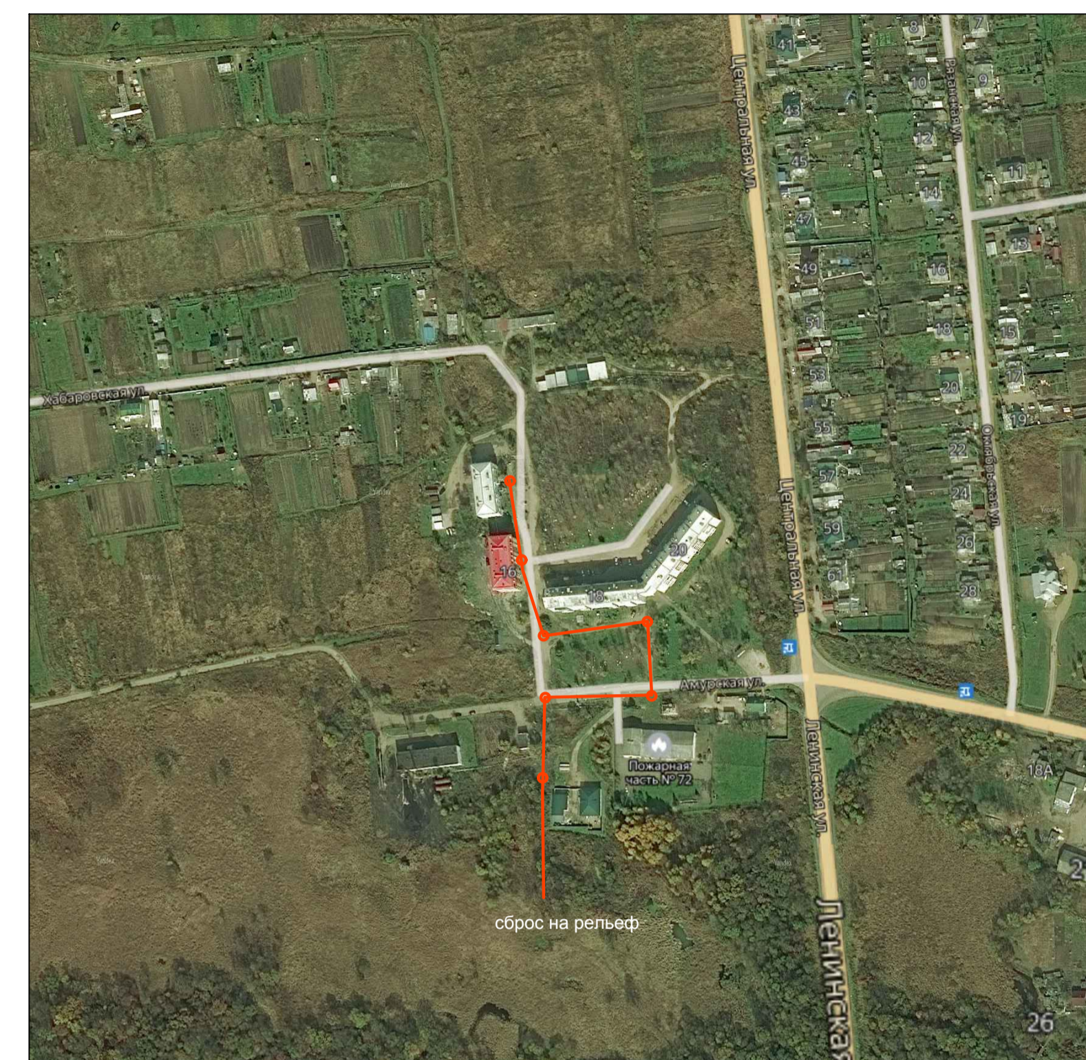
Границы сельского поселения