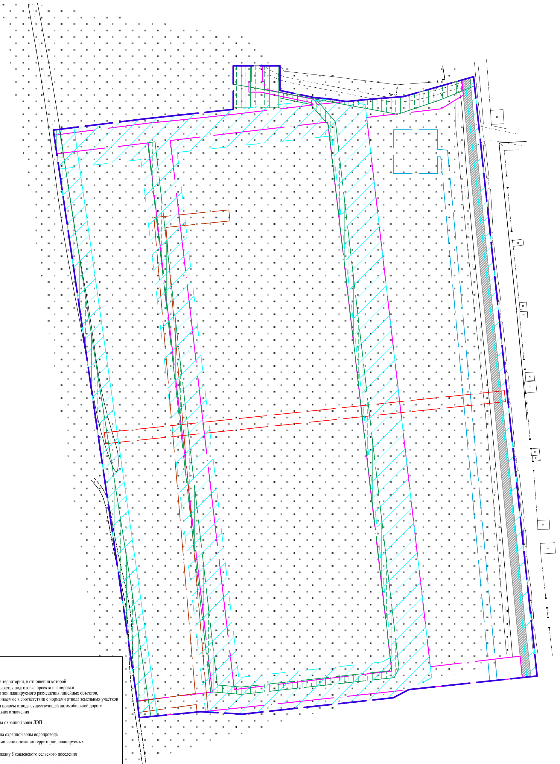
Схема границ зон с особыми условиями использования территории