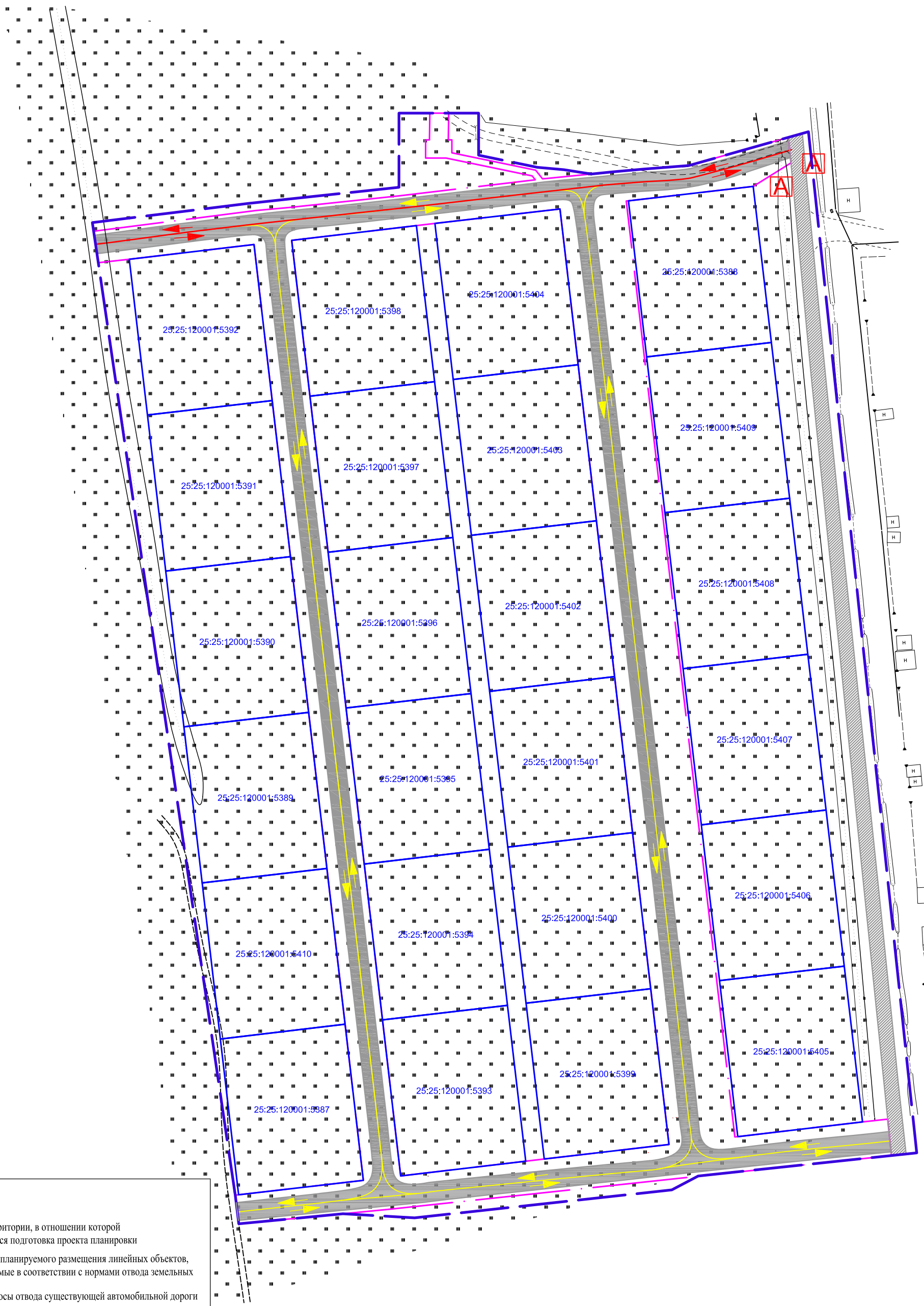
Схема организации улично-дорожной сети и движения транспорта